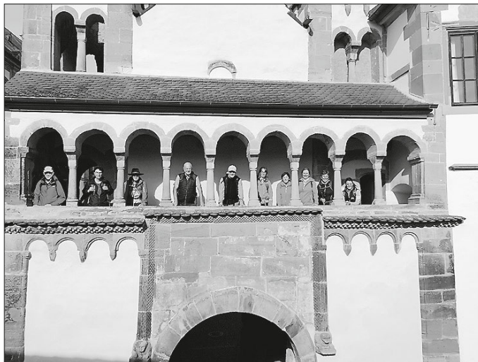
Im Kloster Großcomburg

Die nächste Etappe geht am 3.11.2024 von Braunsbach im Kochertal nach Buchenbach im Jagsttal. Strecke ca. 21 km. gez. Wanderführer Jürgen Pachwald